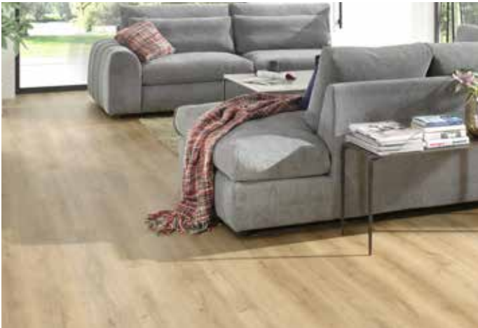
Honey - 1889032