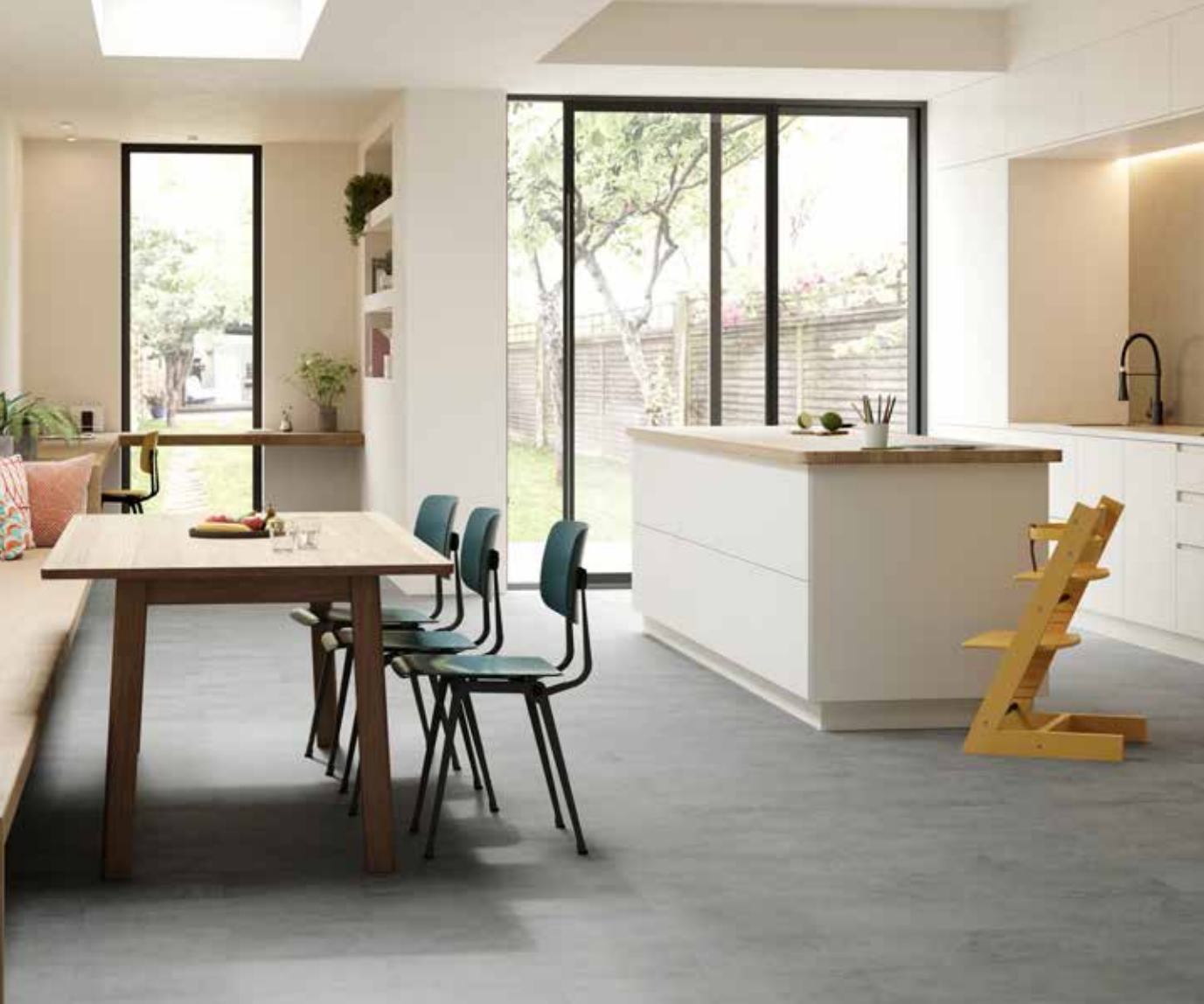
Concrete Clouds - 1889033