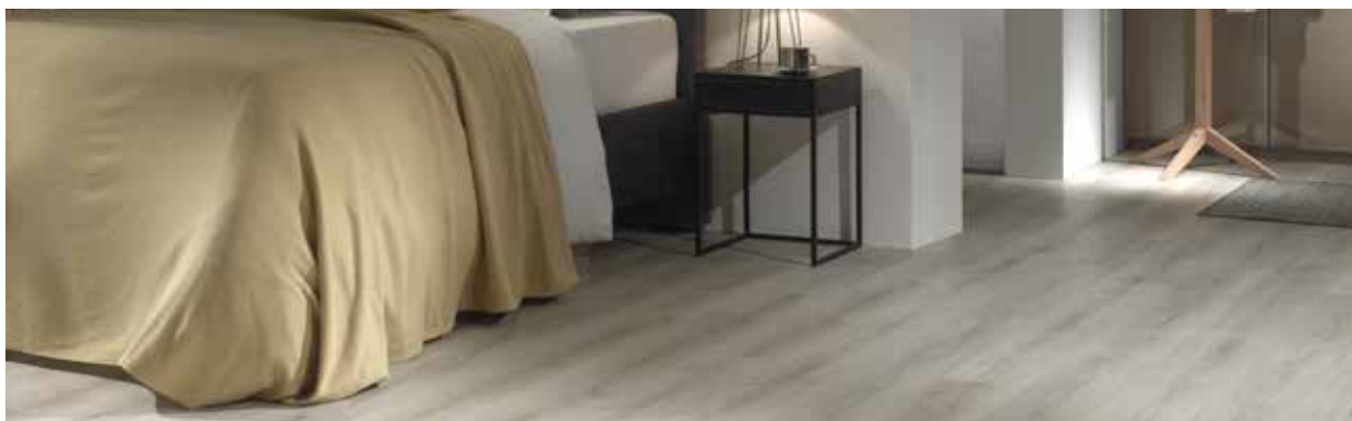
Dusty Grey - 1889022