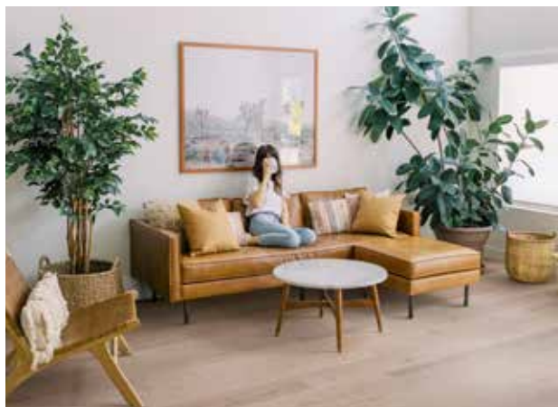
Black Pepper - 1889024