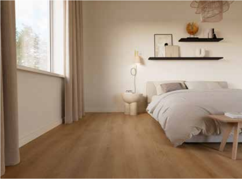
Toffee - 1889025