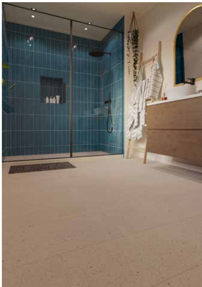
Terrazzo - 1889023