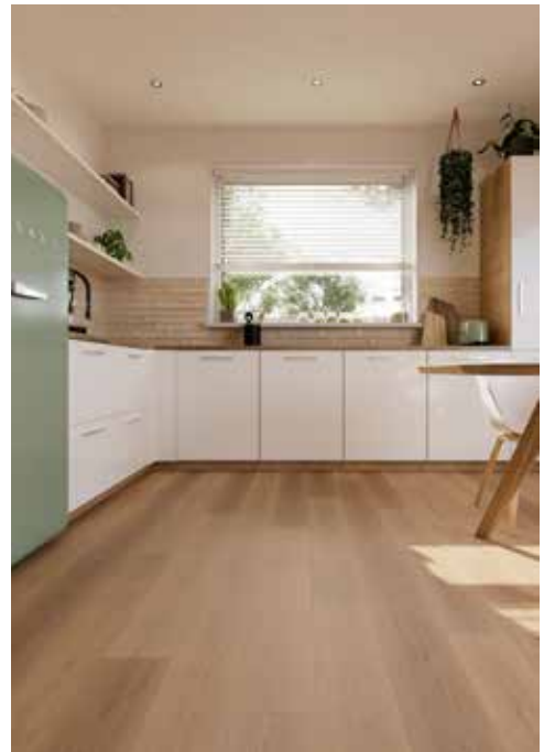
Indian Summer - 1889035